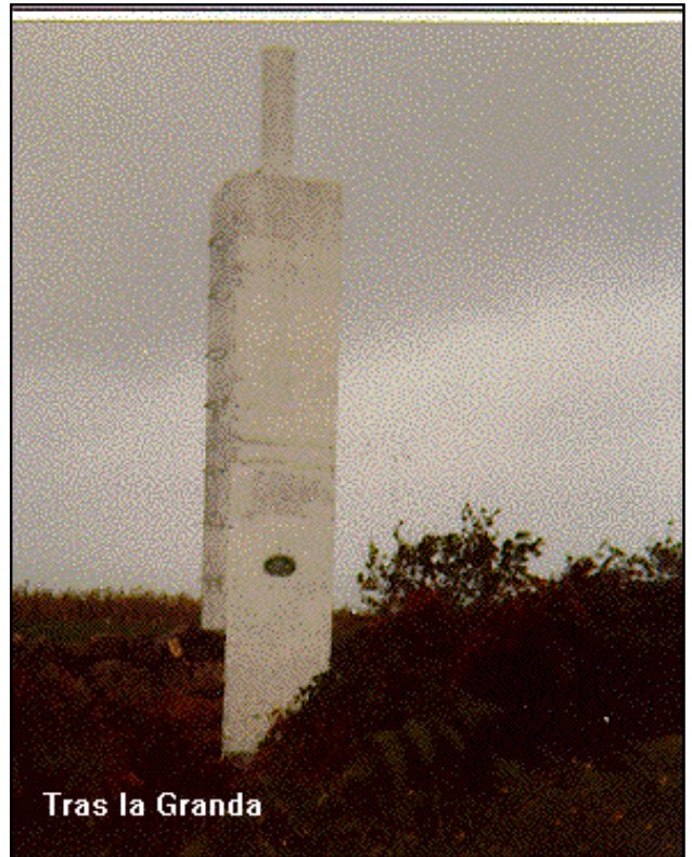
Tras la Granda

Desde El Gobernador (en la carretera Villaviciosa-Venta de las Ranas por Venta de Cuatro Caminos) se sale por la carretera a Tazones. A los 450 m. se deja esta carretera y se sigue a la izquierda por la que va a Tuero y Lloraza, dejando a 650 m. y 1.800 m. dos carreteras a la izquierda; a 1.950 m. se deja otra a la derecha y a los 3.000 m. se llega a Tuero. A la salida de Tuero se toma a la derecha un camino que lleva a la señal, tras recorrer 500 m.