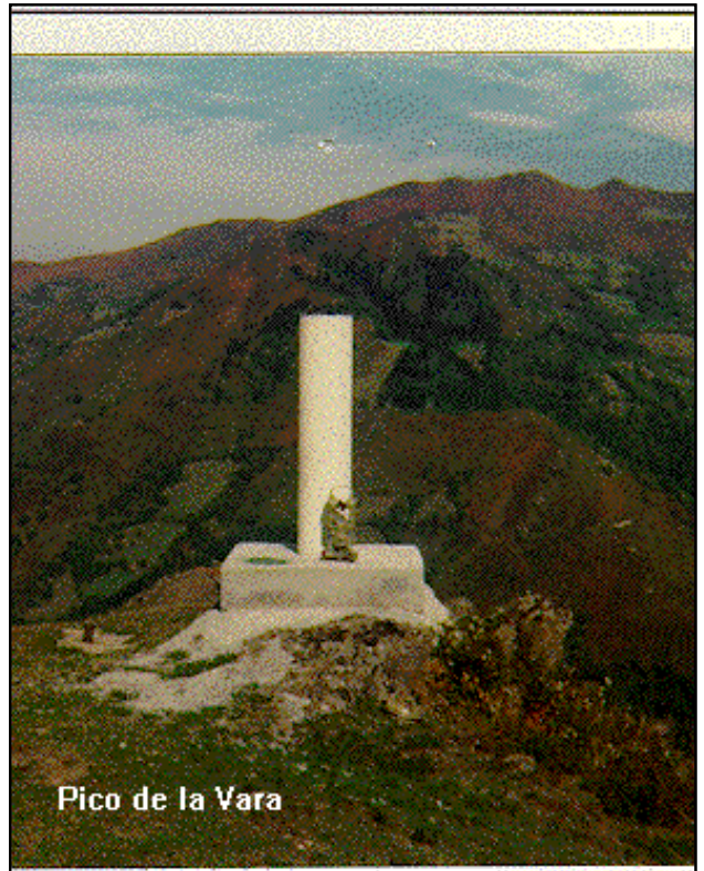
Pico de la Vara